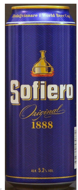
På trods af navnet er den overhovedet ikke alkoholfri

P.S. Husk varmt tøj, fornuftigt fodtøj - og for en sikkerheds skyld også pas og paraply.