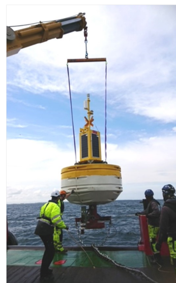
Transmissionsbøje til sensorstreng