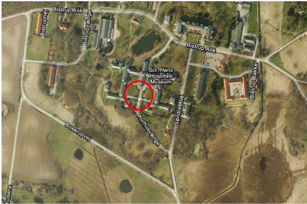
Parkeringsplads ved Sct. Hans hospital (Kurhusvænge)