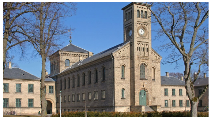
Sct Hans Hospitalskirke