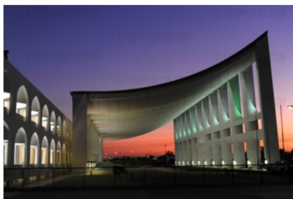
Utzons parlamentsbygning i Kuwait

Før foredraget på DHI bliver der tid til eftermiddagskaffe - og bagefter serveres der tapas. Hvis du kun ønsker at deltage i et af arrangementerne, bedes du oplyse det ved tilmeldingen.