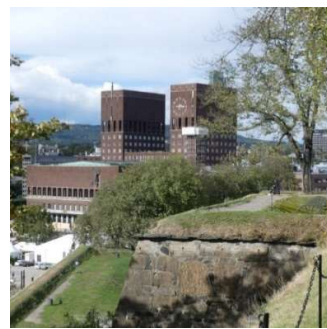
Rådhuset set fra Akershus fæstning