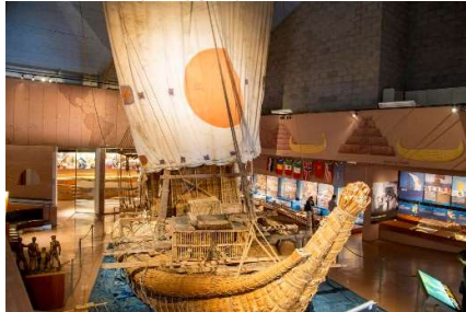
Sivbåden Ra II