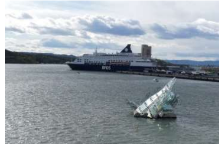
Pearl Seaways set fra Operaen