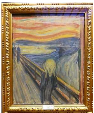
Skriget (uden japanske turister)