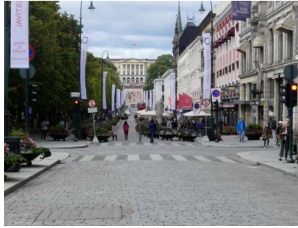
Karl Johan og slottet