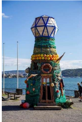
Kunst ved Fram museet