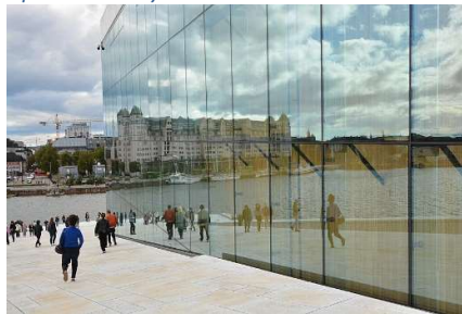
og ned på operaens tag