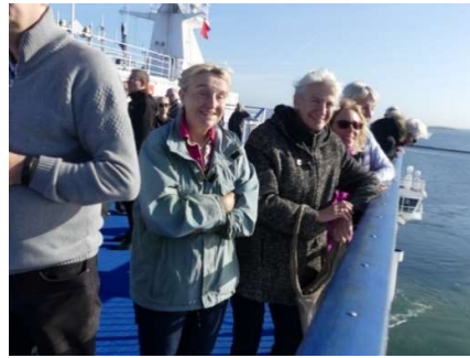
I herligt solskin...