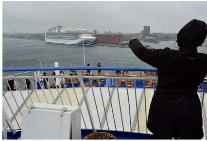
Farvel til regnen