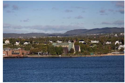
Ankomst til Oslo onsdag morgen