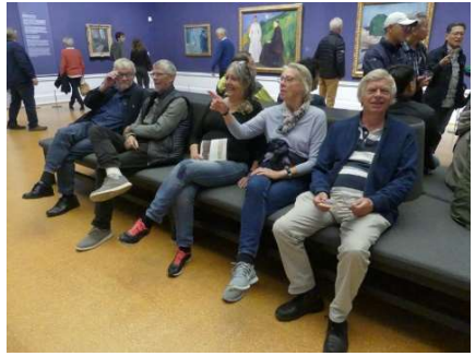
I Munch salen på Nasjonalgalleriet