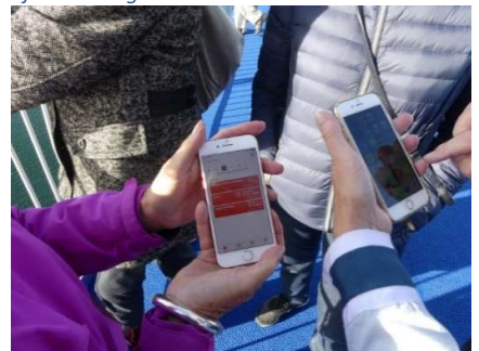
11 km, 18021skridt