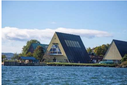
Fram museet på Bygdøy