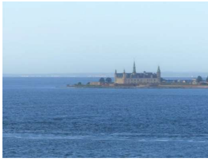
Med Kronborg om styrbord ....