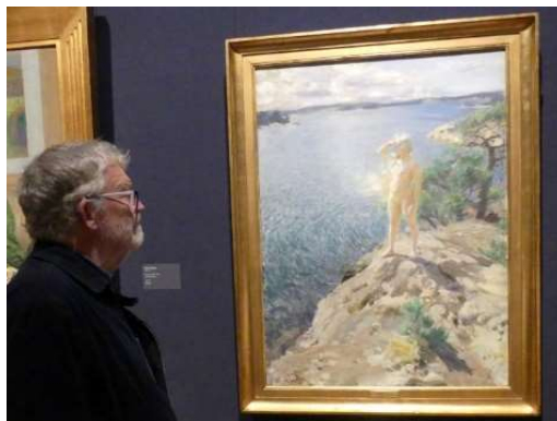
Zorn vs Zorn