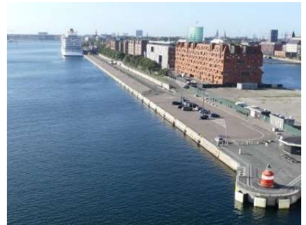
hjem til Langelinie