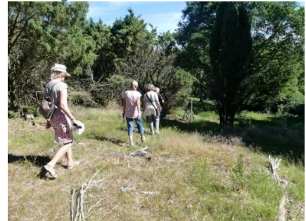
En halv time senere i enebærkrattet