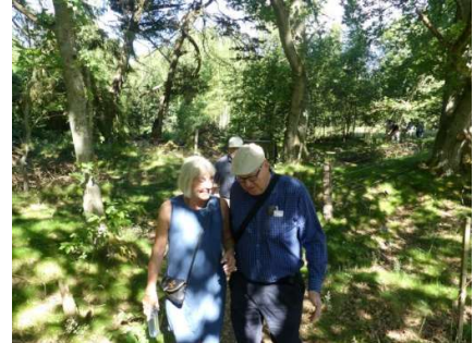
Natur og snak