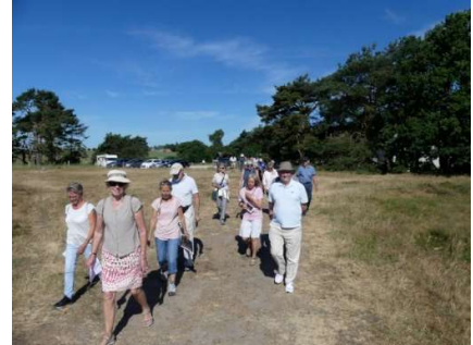
Afgang kl 09:30