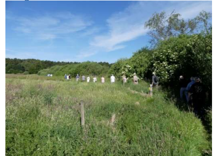
- I gåsegang