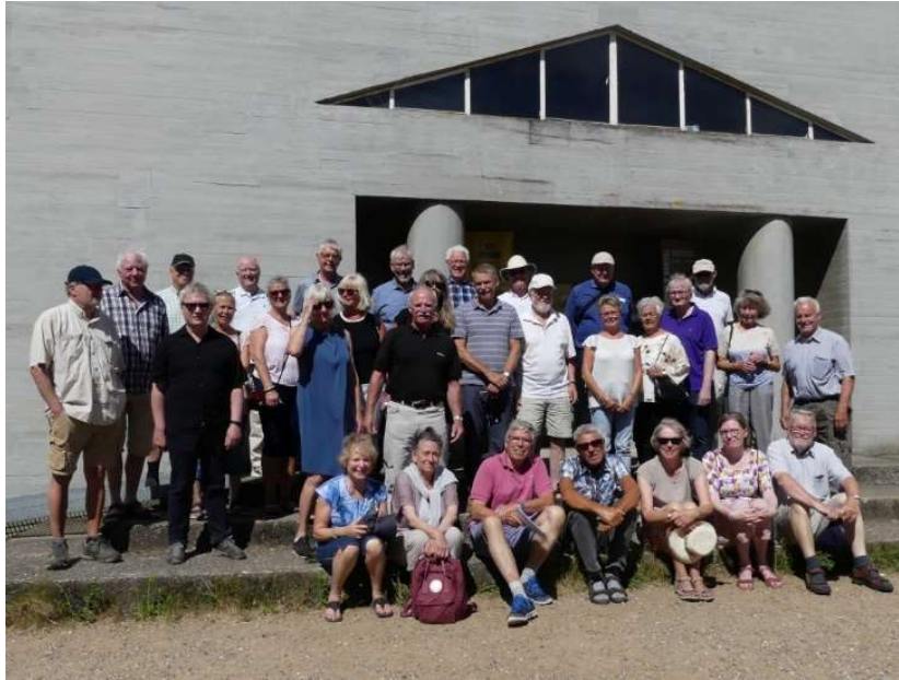
De glade vandrere