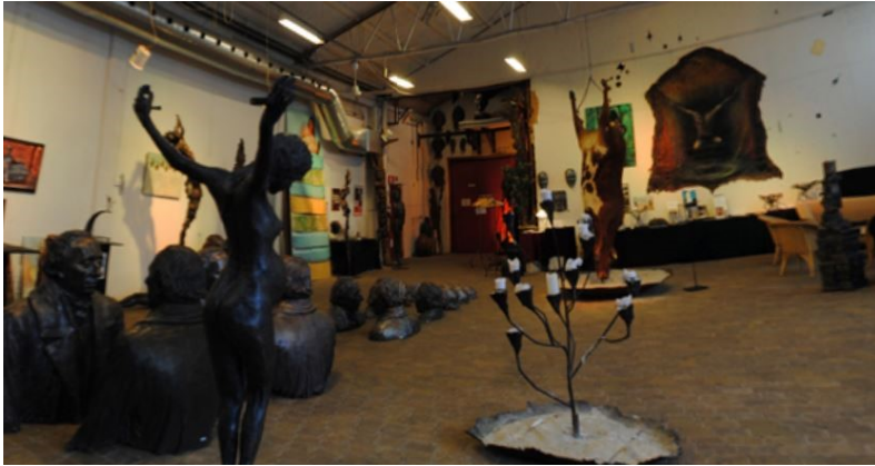
Jens Galschiøts galleri.

Efter morgenmaden kører vi til Faaborg, hvor vi besøger kunstmuseet. Udover den permanente samling har museet året ud en særudstilling om maleren Johannes Larsen og japansk træsnitkunst. Besøget i Faaborg afsluttes med en frokost. Således velforsynede kører vi til Odense, hvor vi har arrangeret besøg hos en moderne kunstner, Jens Galschiøt. Vi ser værksteder, galleri, skulpturpark mm.