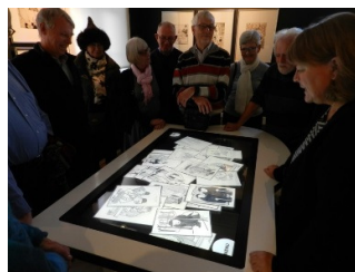
Storm P's tegninger -15.000 på ét bord