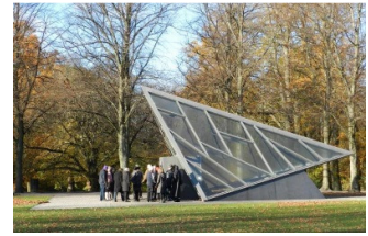
Mødetid kl 10:45