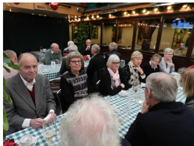
Frokost med familien hos Hansen