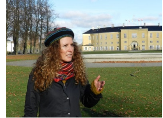
En kompetent guide styrker oplevelsen