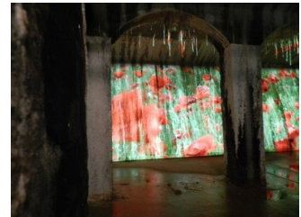
med Eva Koch's valmuemark