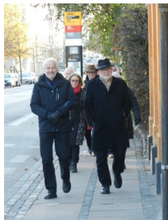
På vej til Storm P Museet