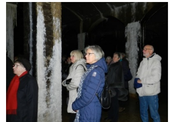
-og opmærksomme tilhørere.