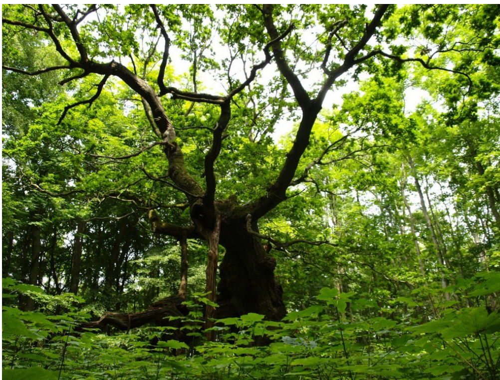
Kongeegen i Nordskoven, Jægerspris