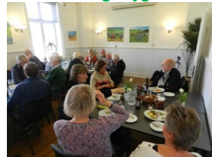
Frokost i Café Danner