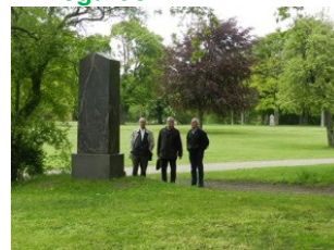
En af mndestøtterne studeres