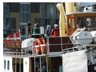
Vi mødtes på soldækket

Herefter besøgte vi kirkegården nord for slotshaven med alle børnegravene fra børnehjemmets tidligste periode. Der var ikke