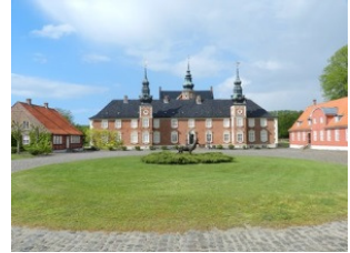
Kl 16:00 Jægerspris slot med 'Hjorteper' i forgrunden