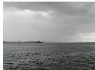
En enkelt regnbyge